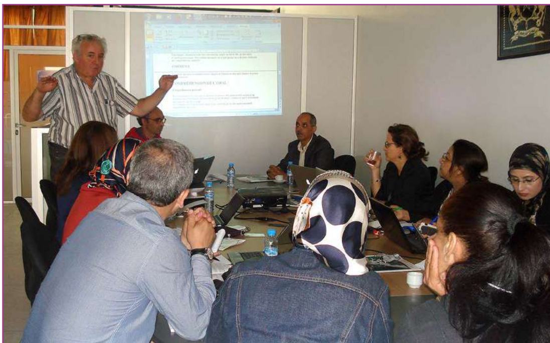
Atelier du groupe Communication à l'UH2C de Mohammedia