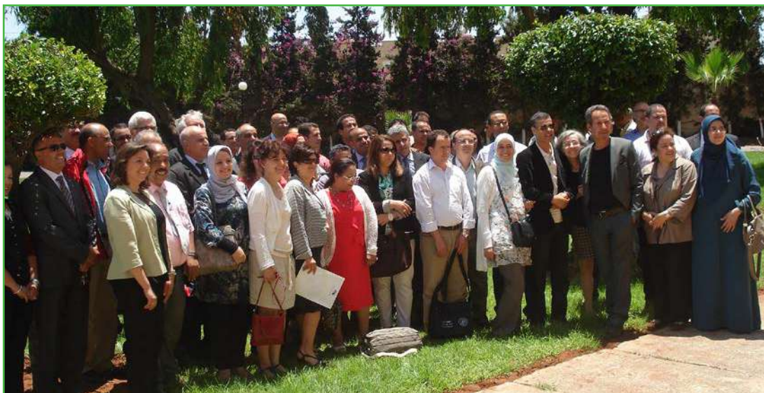
Journées de travail des 4 groupes nationaux à l'UH2C à Mohammédia

Dans cette perspective, il faut réfléchir au modèle économique qui permettrait d'installer ces centres au service de l'ensemble des universités et de leur permettre de se doter des personnels et des infrastructures nécessaires à leur fonctionnement.