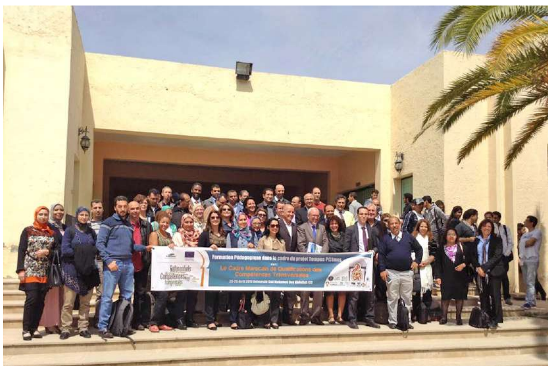
Journées de travail des 4 groupes nationaux à l'USMBA de Fès

Soutenues par l'Union Européenne, elles se sont coordonnées au sein du projet P@LMES pour aboutir, après trois années d'effort, à la création de ces premiers référentiels, à leur expérimentation auprès des étudiants et à la mise en place d'une Commission Nationale marocaine chargée par le Ministère de l'Enseignement Supérieur, de la Recherche Scientifique et de la Formation des Cadres, de s'assurer de la qualité des travaux, de veiller au déploiement progressif des outils et des méthodes élaborés par les groupes de travail dans tous les établissements et de jeter les bases du cadre national de certification marocain. Ce document décrit quelques-uns des résultats de P@LMES, en particulier les 4 référentiels de compétences issus des réflexions de la communauté universitaire marocaine.