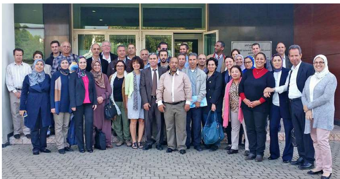
Journées de travail des 4 groupes nationaux à l'UH2C de Casablanca