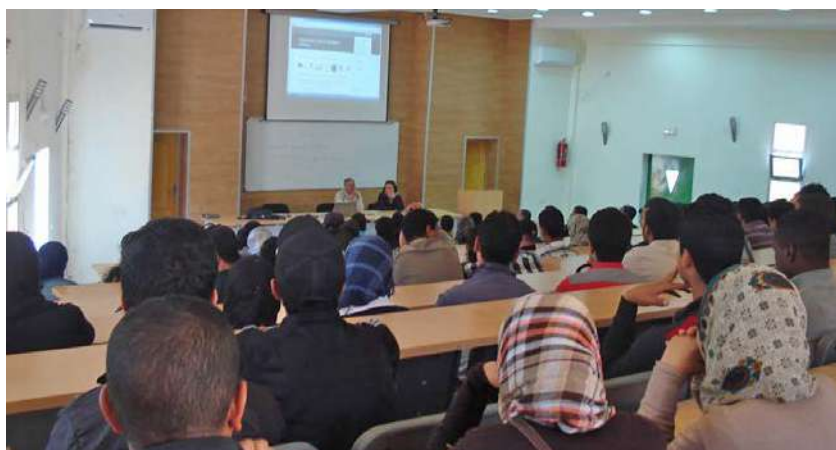
Lancement de l'expérimentation de la certification TIC à Beni Mellal