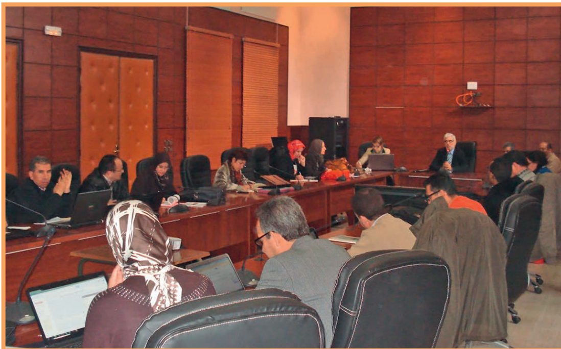
Réunion du groupe national à l'UCD de El Jadida