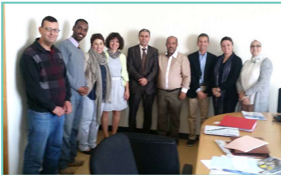
Réunion du groupe national à l'UH2C de Casablanca