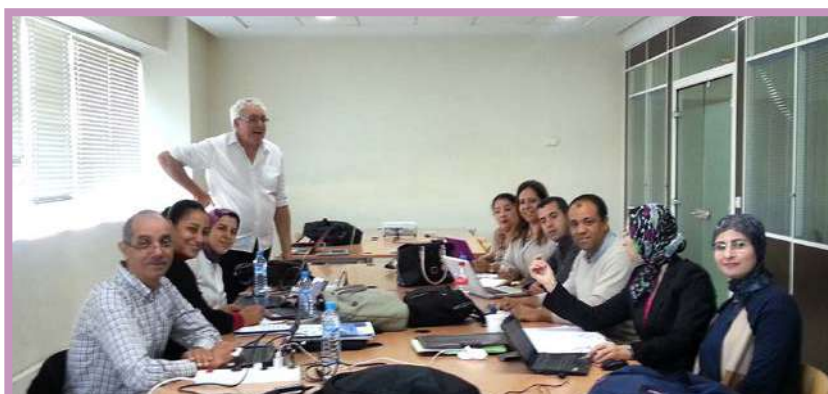
Réunion du groupe national à Casablanca