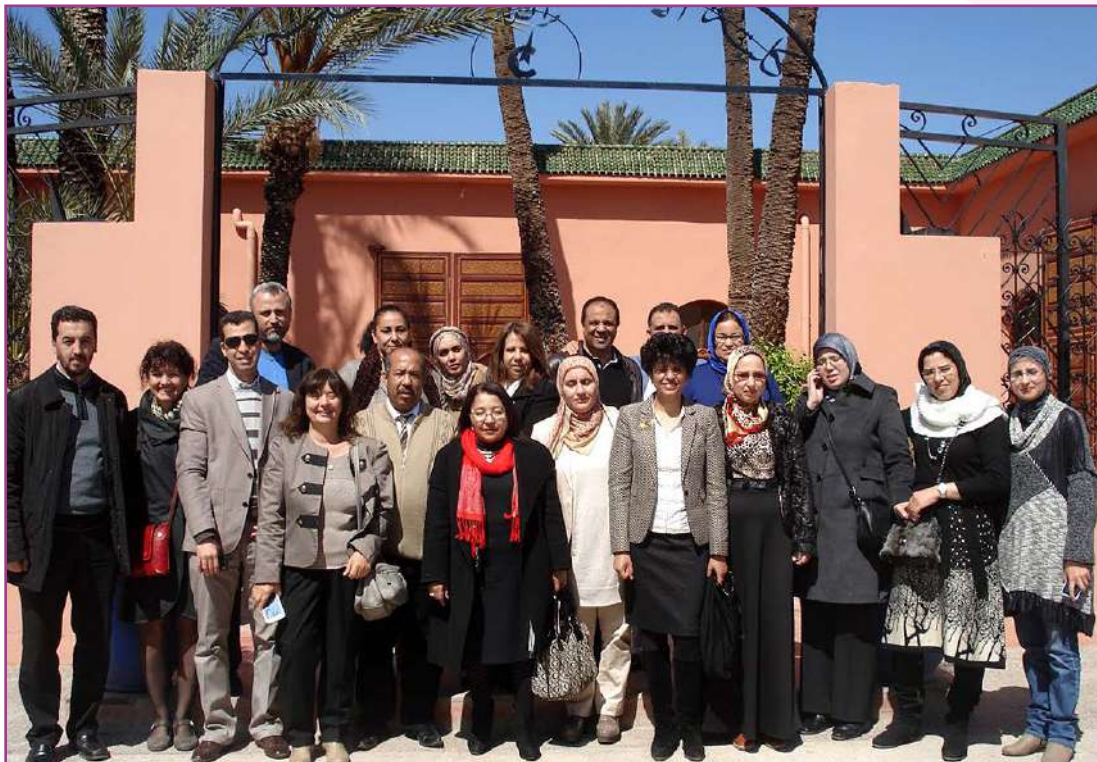
Journée de lancement du groupe Communication à Marrakech