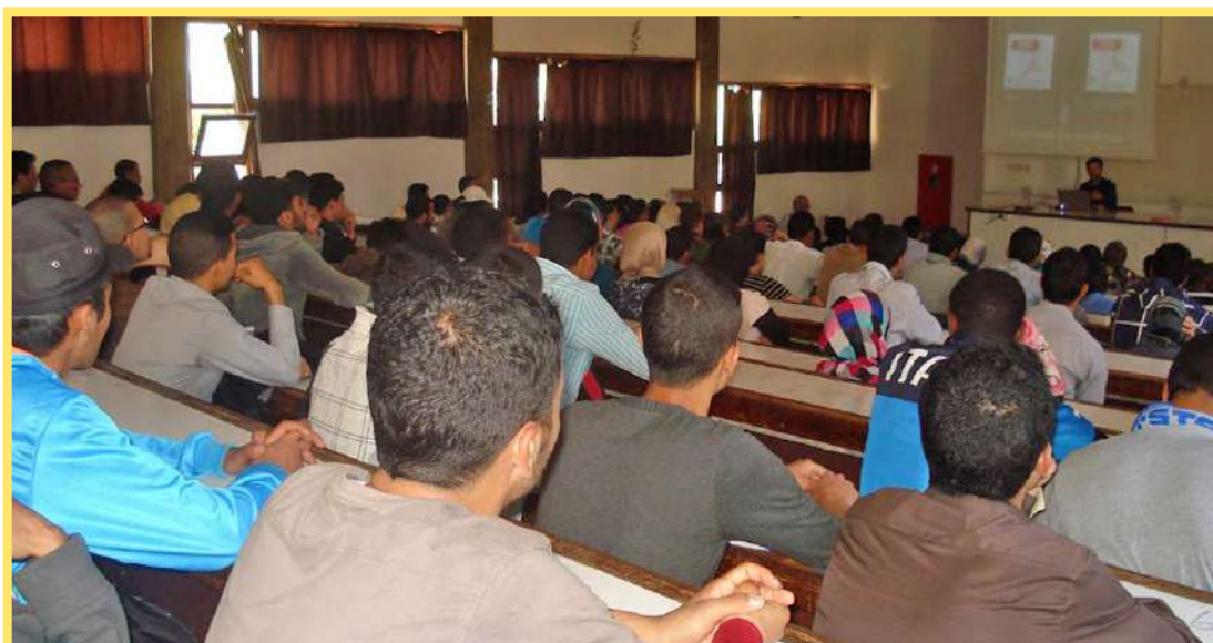
Lancement de l'expérimentation de la certification TIC à Agadir