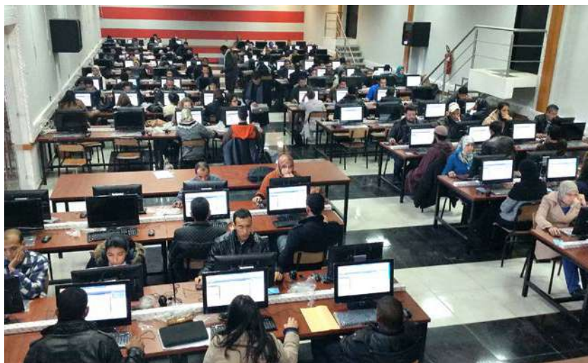
Test de positionnement pour la certification TIC