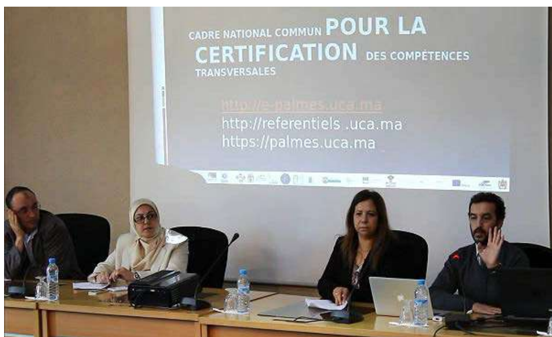
Les responsables des 4 groupes nationaux

C'est une COMMISSION regroupant tous les établissements universitaires. Elle est placée sous l'égide du Ministère de l'Enseignement Supérieur de la Recherche Scientifique et de la Formation des Cadres. Elle doit approuver l'ensemble des référentiels de compétences transversales communs. Elle considère pour cela les propositions faites par les équipes pédagogiques impliquées dans la formation et l'évaluation des compétences dans les domaines de l'entrepreneuriat, des TIC, de la Communication ou de la Gestion de projet.