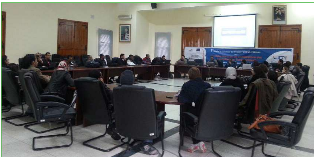
Journées de travail des 4 groupes nationaux à l'UMI de Meknès